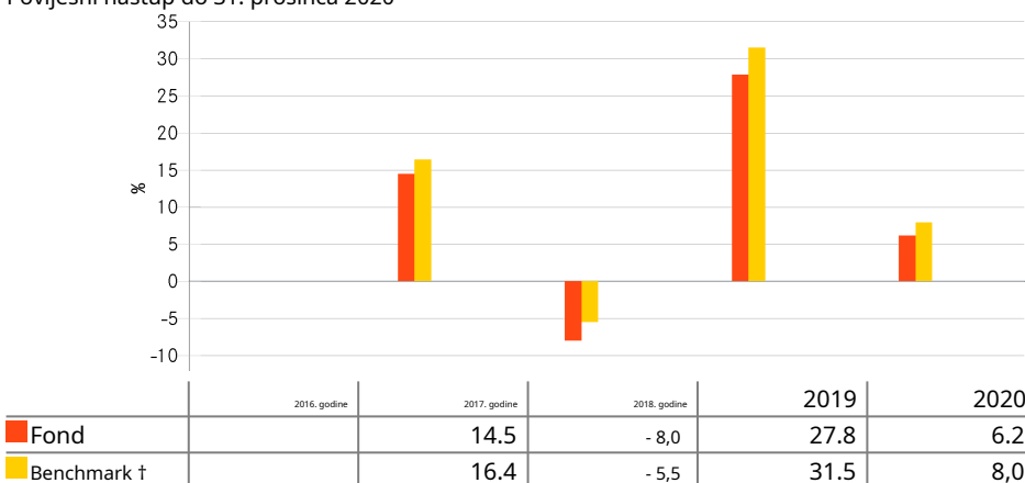
Povijesni nastup do 31. prosinca 2020

† Mjerilo: S&P 500 Indeks minimalne volatilnosti (USD)